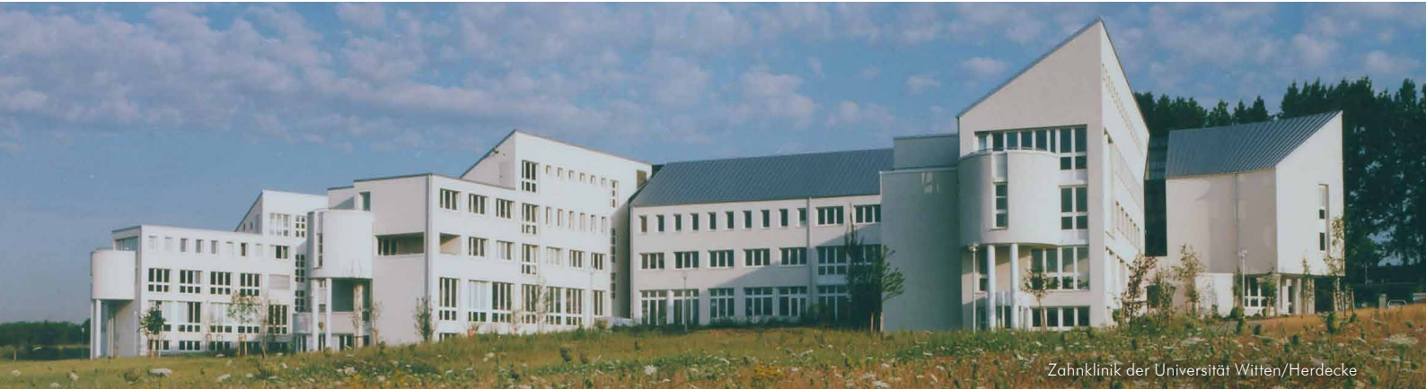
Zahnklinik der Universität Witten/Herdecke